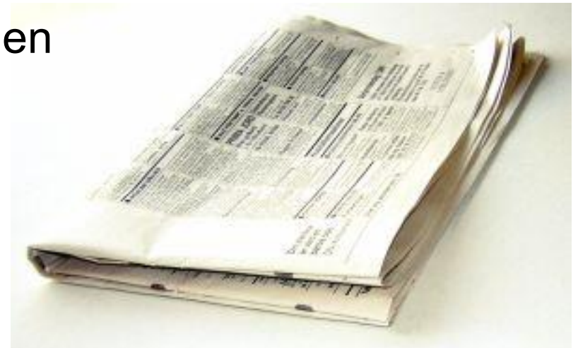
Van patiënt tot zorgconsument